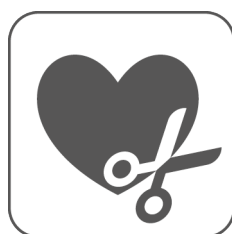
erhältlich im Wunschmaß